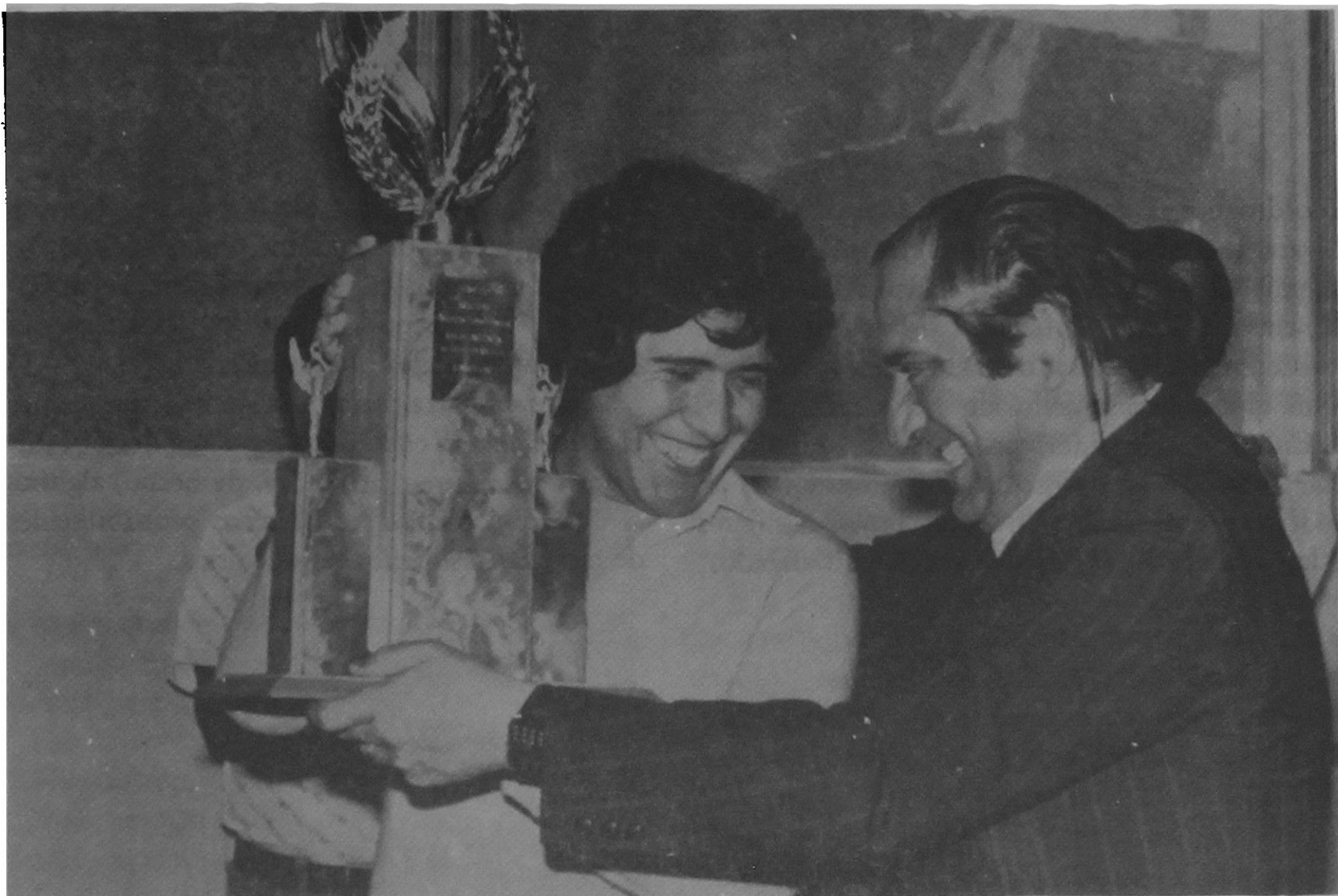
Trofeo de las XII Olimpiadas, obtenido por los alumnos de la Facultad en alianza con Educación Diferencial.