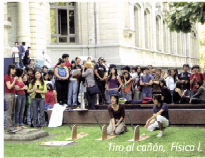
Tiro al cañón, Física I.

Cada año aumenta el porcentaje de estudiantes de regiones que participan en la iniciativa. En 2007 y 2008 alcanzaron el 42%.