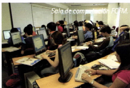
Sala de computación FCFM.