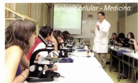
Biología celular - Medicina.