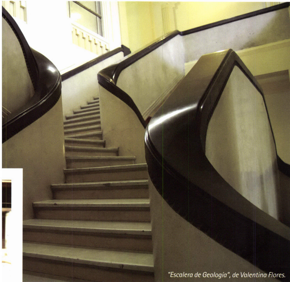
"Escalera de Geología", de Valentina Flores.