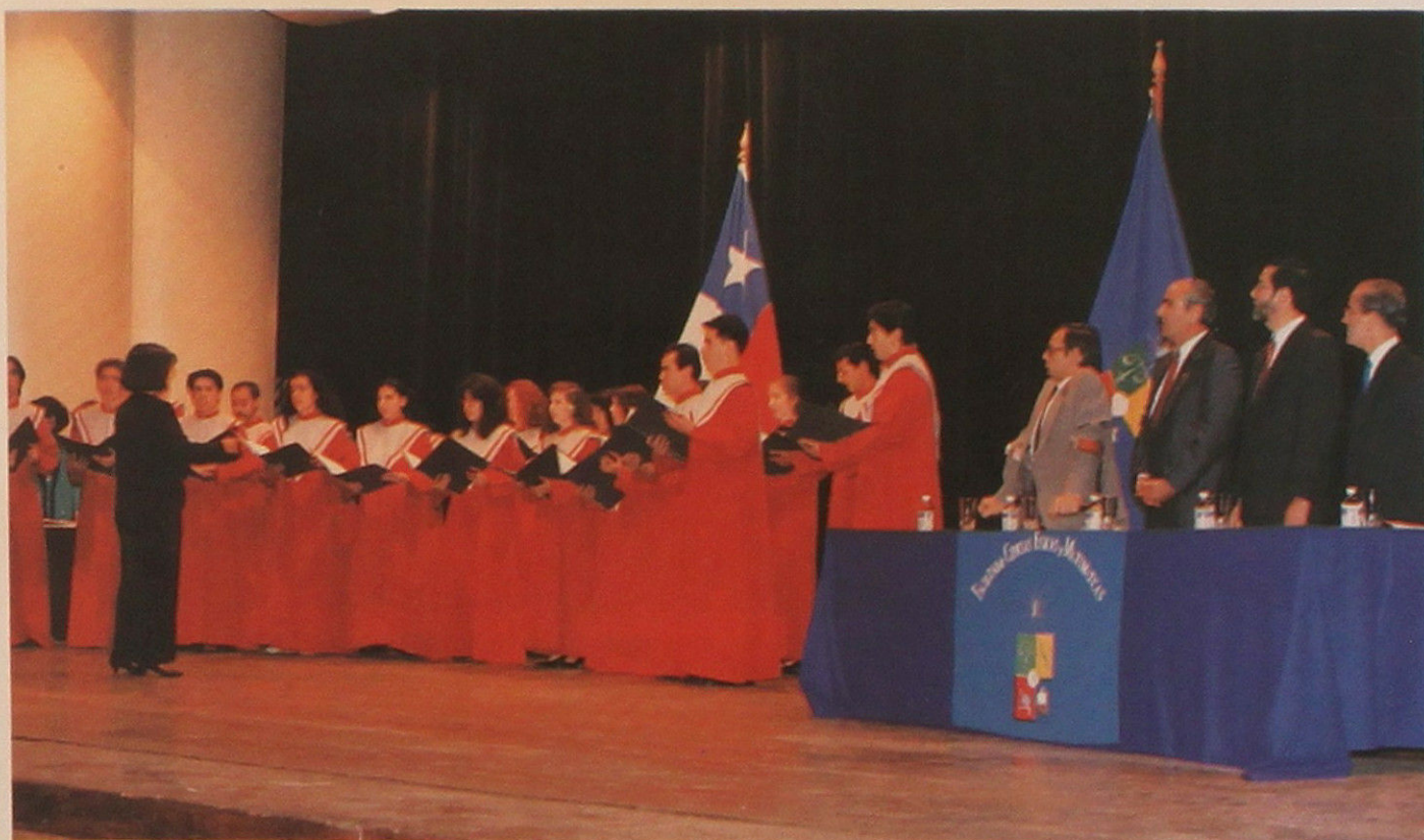
El Coro de la Escuela de Ingeniería y Ciencias interpreta el Himno de la Universidad de Chile

Al finalizar la ceremonia, se les reiteró a los ex-alumnos el deseo de éxito y felicidad en la nueva etapa de sus vidas, y se les recordó que siempre las puertas de la Facultad estarán abiertas para acogerlos.