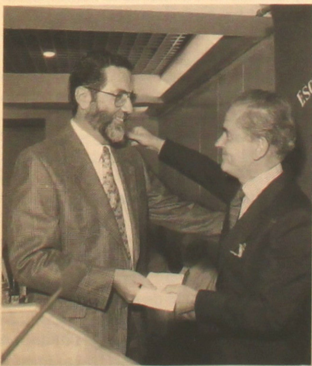
El presidente del Instituto entrega dos becas para estudiantes de Ingeniería.

El próximo almuerzo del Instituto de Ingenieros de Chile, se realizará como es habitual en el Club de la Unión, el 6 de mayo, siendo en esa oportunidad el orador principal, el Ministro de Minería Sergio Jiménez.