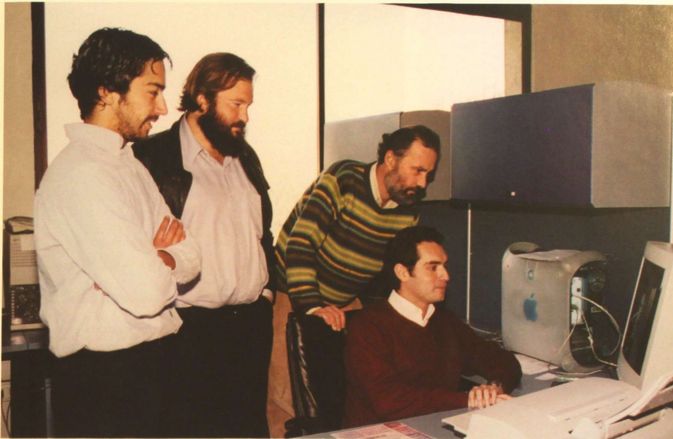
Grupo de Emprendedores (Incubandos)

Cuatrocientos mil dólares obtuvo el proyecto "Creación de la Asociación Nacional de Incubadoras de Negocios", presentado por la Incubadora AccessNova de los Departamentos de Ciencias de la Computación e Ingeniería Industrial al concurso organizado por el Banco Mundial. En este concurso se presentaron más de 80 proyectos a nivel mundial.