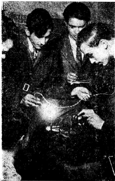
Un grupo de alumnos de la Escuela de Mecánica de Automóviles, de la Universidad Popular, en plena actividad.

La librería de la Universidad Popular expende todos los artículos que necesitan los estudiantes a precios de costo, lo que permite reba-