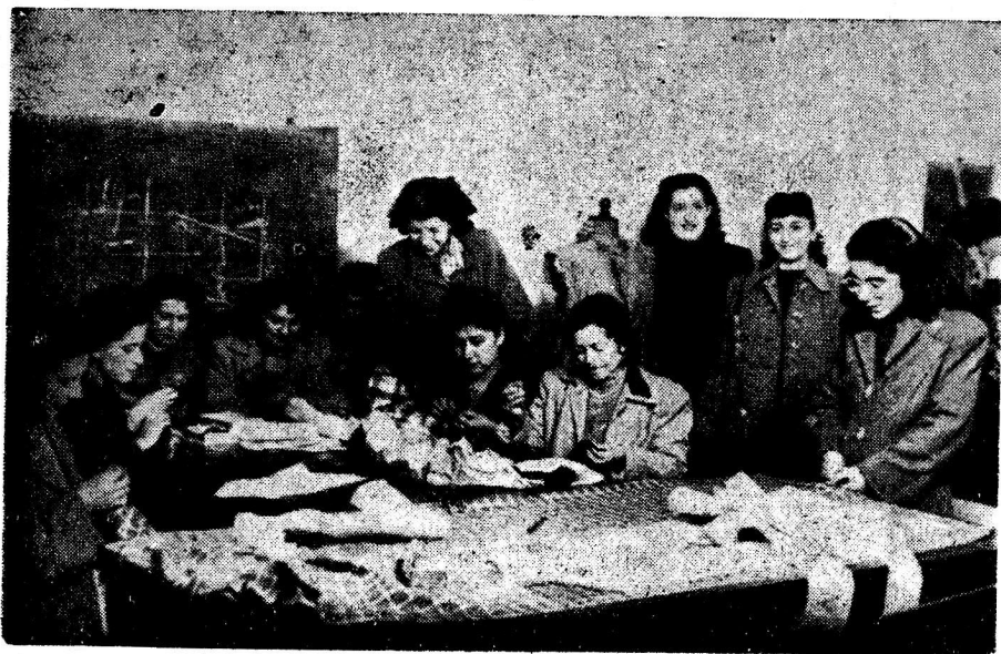
La Escuela de Corte y Confección de la Universidad Popular, concentra a numerosas señoritas.

Este servicio que funciona dos temporadas al año tiene una matrícula que fluctúa entre los 400 y 500 alumnos anualmente.