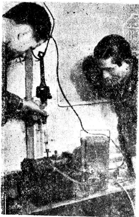
Un aspecto del trabajo técnico que realizan los alumnos de la Universidad Popular. (Ver informaciones en páginas interiores).

Universidades Populares y quince Liceos Nocturnos. El temario preparado consulta la discusión de los principales problemas de estos or-