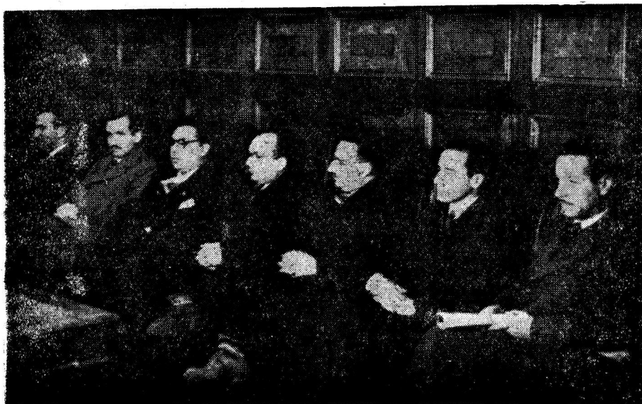
El Consejo de la Universidad Popular "Valentín Letelier", preside el acto solemne realizado en el Salón de Honor de la Universidad de Chile con motivo del 3.er aniversario de su fundación.

Para los efectos de su trabajo, la Universidad Popular mantiene los siguientes Departamentos, con sus organismos respectivos: