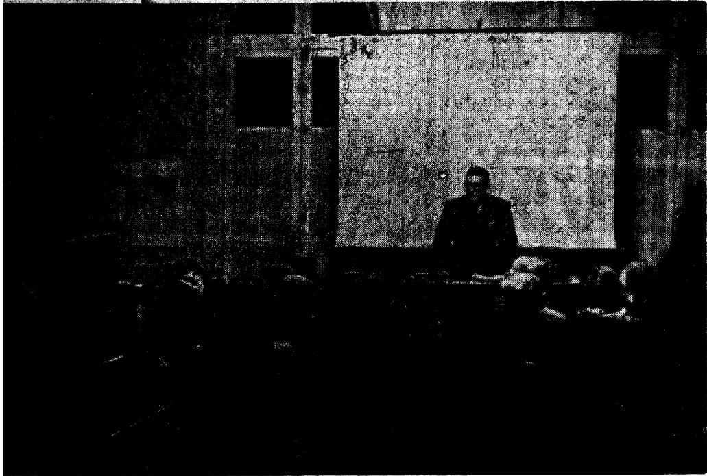
La sala de Conferencias del Instituto Chileno-Francés de Cultura, durante una charla con proyecciones luminosas

das a Chile; se dan conciertos de música selecta, tanto por medio de discos como por medio de intérpretes; se patrocinan exposiciones de cuadros; se programan audiciones radiofónicas dominicales; y se organizan bailes, que tienden a poner en mayor contacto a profesores y alumnos.