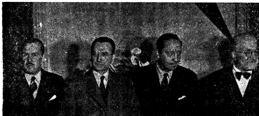
Inauguración de los Servicios de Difusión Cultural de la Universidad de Chile, en Alameda 528, con asistencia del Rector, decanos, autoridades