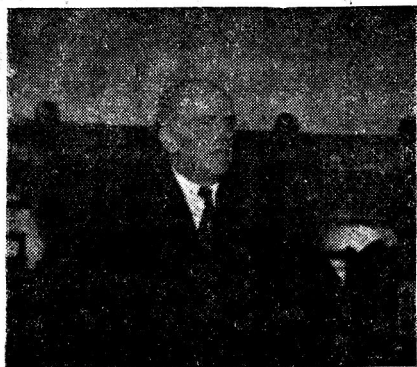
El Profesor italiano Guido de Ruggiero, durante una de sus conferencias.