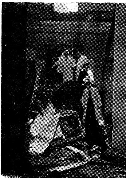
Médicos de la Escuela, visitaron los daños