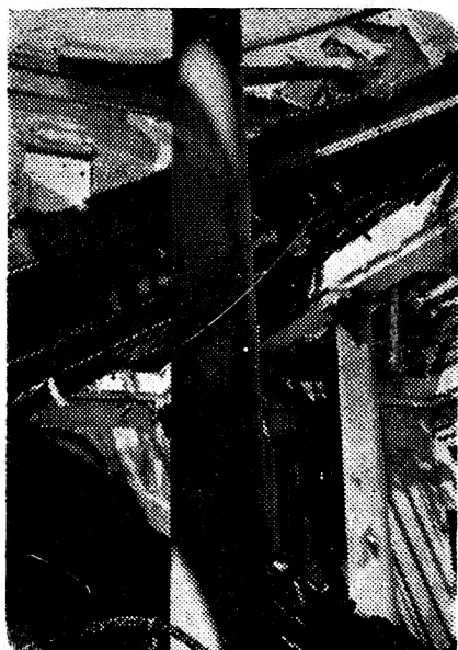
La destrucción desde una de las galerías interiores

de Biología, del Museo de Anatomía Patológica, del laboratorio de Bacteriología, del departamento de Parasitología, del departamento de Química, donde se estaban haciendo ya experimentos de transmutación atómica, del Laboratorio de Química Fisiológica, del laboratorio de Física que perdió instrumentos tan valiosos como los de los rayos X, del Instituto de Fisiología, con 152 alumnos, donde se hacían trabajos tan importantes como los de la hormona tiroidea.