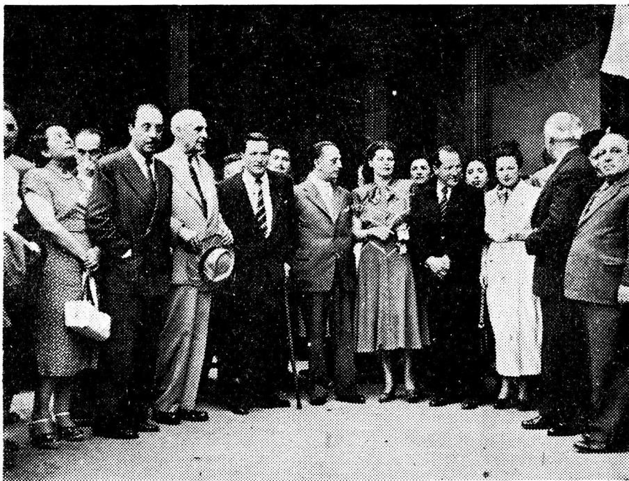
Autoridades Educativas, durante la despedida a los alumnos de la Escuela de Verano en Peñalolén.

Esta Escuela propende, preferentemente, formar al niño como ciudadano, para que llegue a ser un perfecto colaborador social. Son los Estudios Sociales, en quienes descansa la responsabilidad máxima de esta formación, contribuyendo a desarrollar en el niño un amplio espíritu solidario, que sepa ser leal a su país y que comprenda que la época que le ha tocado vivir, se desenvuelve en un clima de estrechas interrelaciones, y que de su actitud como ciudadano dependerá el porvenir de la Humanidad.