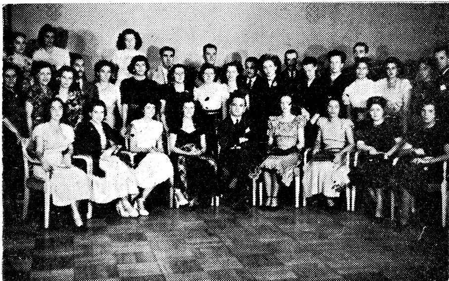
Alumnas de Brasil, festejaron con un cóctel al Rector de la Universidad.