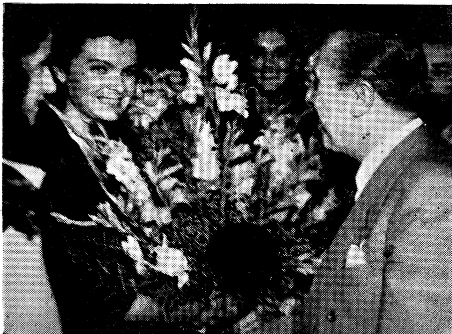
Alumnas de Brasil entregan un ramo de flores a S. E.