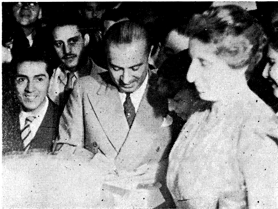
Alumnos extranjeros de la Esc. de Verano visitan a S. E. el Presidente de la República.