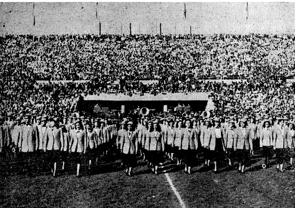
Conjunto del Coro Universitario en su presentación durante el último Clásico Universitario, la tradicional competencia anual entre la Universidad del Estado y la Universidad Católica.