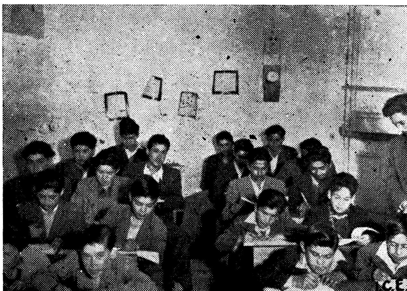
Uno de los cursos de alfabetización.

Aquí los obreros encuentran clases de Alfabetización o completación de estudios primarios. Para lo primero hay cursos de cuatro meses, para lo segundo, cursos sistemáticos de diez meses, cuyos estudios son reconocidos por el Estado para continuar en la Enseñanza Media o Profesional Completa la labor de esta Sección, conferencias periódicas, conciertos