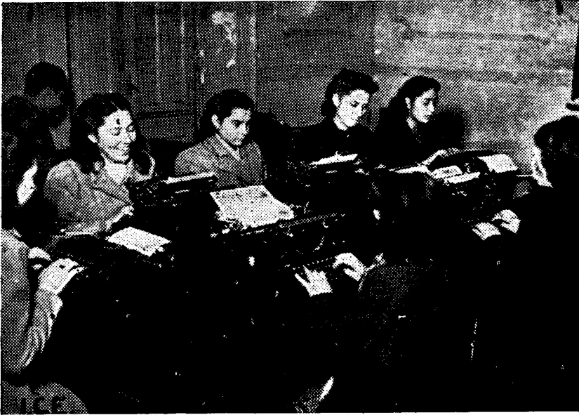
Curso de mecanografía del Instituto Comercial diurno.