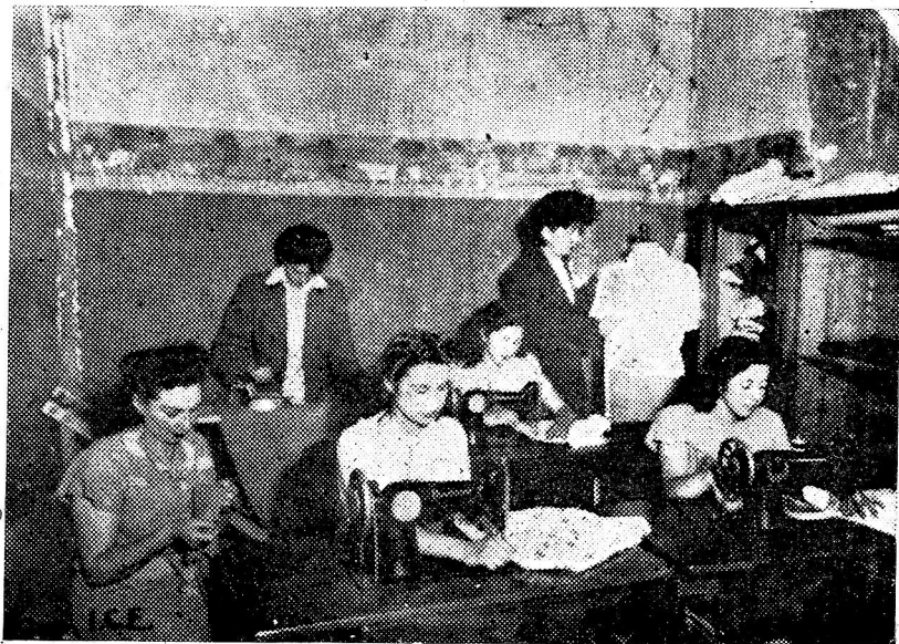
Señoritas del curso de Corte y Confección.

Necesario es también destacar la importancia que la Universidad Popular ha