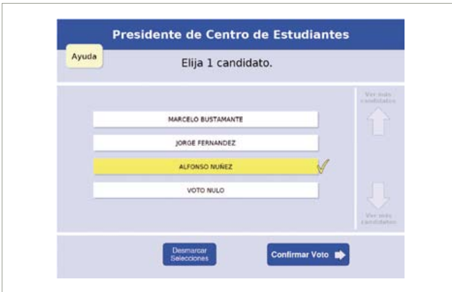
Interfaz de sistema de votación electrónica.

las cuales miembros del CLCERT trabajan son: