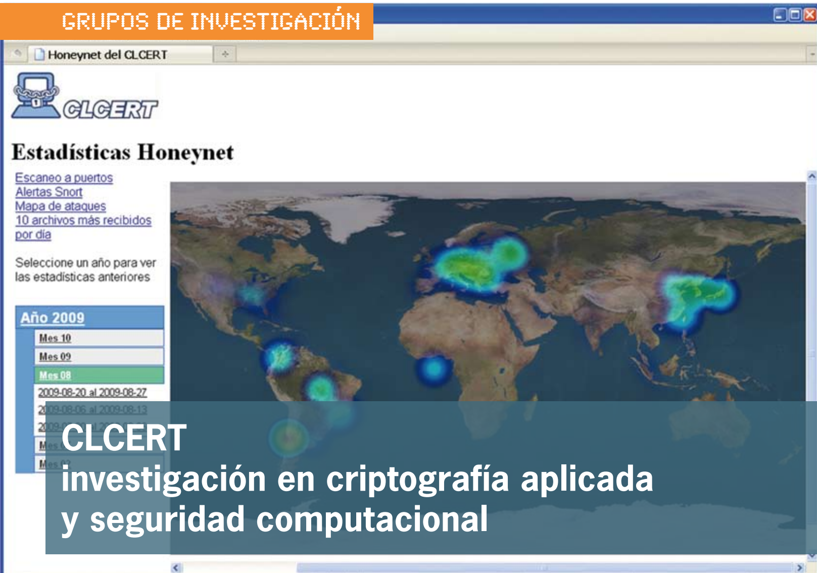
Mapa de ataques computacionales.