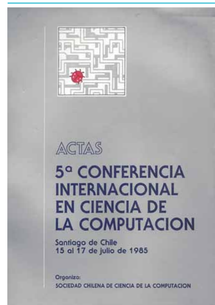
FIGURA 4. ACTAS 5TA. CONFERENCIA.

En los primeros años, y de acuerdo a sus objetivos fundacionales, la SCCC estableció relaciones con instituciones profesionales y científicas, internacionales y nacionales. En 1988 la Sociedad ya era miembro de CLEI y tenía representación en IFIP. En el ámbito nacional, la SCCC se incorporó como sociedad afiliada al "Instituto de Ingenieros de Chile" [39] e interactuó ocasionalmente con el Colegio de Ingenieros con un anteproyecto sobre acreditación de carreras de Ingeniería en Computación [40] y un informe sobre el desarrollo informático nacional [41].