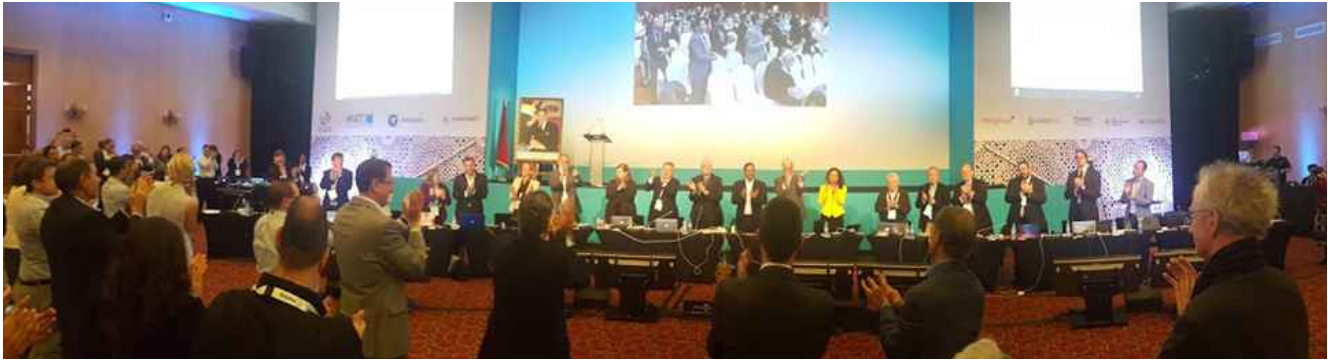
IMAGEN 2. REUNIÓN NÚMERO 55 DE ICANN, 7 AL 11 DE MARZO DE 2016.

cuando quedó en evidencia que el control último de la zona raíz lo tenía el Gobierno de Estados Unidos. Esto porque había contratos de investigación que financiaron el funcionamiento de la IANA en sus inicios, los que originados en ARPA, luego transferidos a la NSF y finalmente a cargo del Departamento de Comercio (DoC), significaban en la práctica que ningún cambio se podría hacer en la raíz sin el visto bueno del DoC.