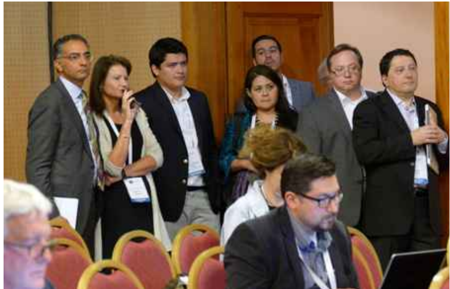
IMAGEN 3. AUTORIDADES DE ICANN OBSERVAN DECISIÓN DE CCNSO.

Evidentemente, el proceso de diseño y de construcción de acuerdos para llegar a definir este proceso fue largo y complicado, porque en él se evidenció el delicado equilibrio de poderes entre los distintos actores, muy en especial el de los gobiernos agrupados en el GAC. Una de las incógnitas de la reunión de Marrakech era si el