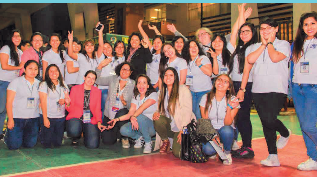
IMAGEN 3: EQUIPO ORGANIZADOR DE LATiNiTY 2017 CON LAS VOLUNTARIAS DE LA CONFERENCIA.