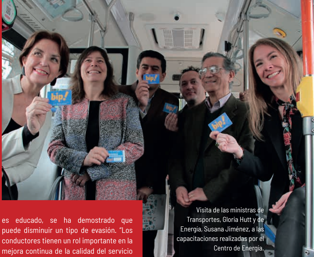
Visita de las ministras de Transportes, Gloria Hutt y de Energía, Susana Jiménez, a las capacitaciones realizadas por el Centro de Energía.