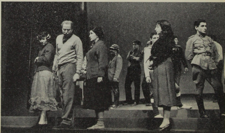
Otra escena de "El Abanderado", en uno de los ensayos finales

Son innumerables las labores que cumple el rruch. Por facultad de la ley, ha quedado en sus manos el otorgamiento de la calidad de Compañía Nacional, que reporta una serie de ventajas a los conjuntos escénicos. Desde otro punto de vista y como estímulo a la labor autoral, se realizan seminarios de autores, lecturas dramatizadas de obras de jóvenes dramaturgos, con foro crítico, que les permite a los autores recién iniciados en estas labores enfrentar opiniones autorizadas frente a creaciones incipientes. Por otra parte, numerosos integrantes del rruch asesoran, como directores, a conjuntos estudiantiles, gremiales, universitarios y de poblaciones; cada cierto tiempo se efectúan festivales nacionales de teatros aficionados y se estimula también la creación que realizan los autores de teatro infantil. Ahora, nuevas aspiraciones estimulan a los intérpretes universitarios; una de ellas, quizá la más importante, obtener un edificio propio, donde se construya un teatro que no sólo cubra sus actividades sino sirva a otros elencos y posea todos los elementos de la moderna técnica. Los 21 años que ha cumplido el rruch son la mejor razón para la justicia de este anhelo.