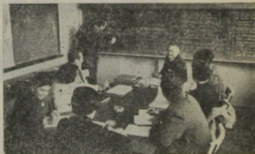
Trabajo de equipo en la asignatura de administración en salud pública