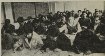
Curso de estadísticas vitales y sanitarias