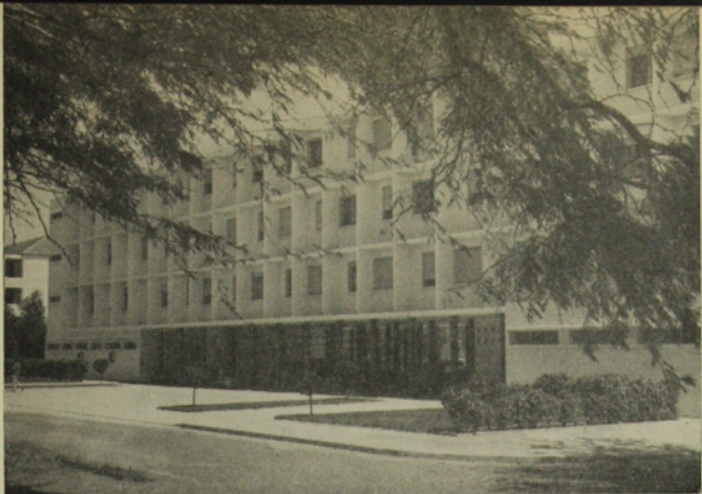
Facultad de Medicina de la Universidad de Dakar