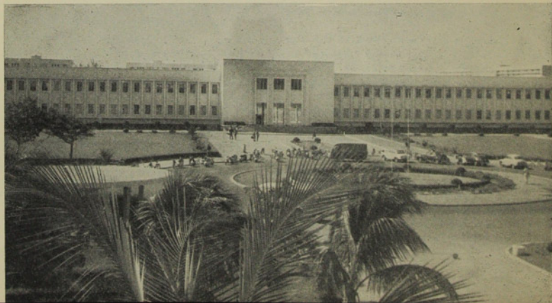
Edificio de las Facultades de Derecho y Ciencias Económicas y de Letras y Ciencias Humanas de la Universidad de Dakar.

Senegal, república independiente desde hace menos de una década, figura como se sabe, entre los países menos extendidos del continente africano. Con una población de tres y medio millones de habitantes, y un aumento anual de población (desde 1958) del 2,7%, la República senegalesa se encuentra en el punto de partida de un desarrollo en todos los órdenes, para la expansión económica y social del pueblo, hasta hace poco encerrado en la política colonialista del virtualmente ya inexistente imperio colonial francés. Base de este futuro desarrollo ha de ser, es obvio, el incremento más amplio de la educación, y desde luego, la diversificación y expansión de la educación superior, cuyo pilar principal lo constituye la Universidad de Dakar. En este pueblo de 3 millones 500 mil habitantes, las cifras de la educación dan este resultado: 185 mil estudiantes en primaria, 24 mil en secundaria, 3 mil en