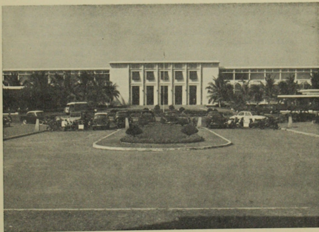
Otro rincón de la Ciudad Universitaria de Dakar