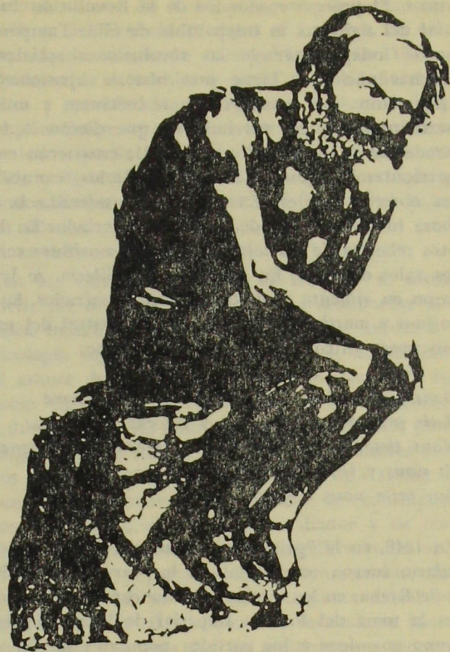
Marx representado en este dibujo de Ernest Socolov en la actitud del Pensador de Rodin

Alguien puede preguntarme: ¿Cómo es posible que un tema así se descubriese en Chile? La razón es simple: en ningún país hubo tanta riqueza numismática ilegítima como en Chile. Las oficinas salitreras rivalizaban en ofrecer los más variados tipos y series. Además, el país había sido el primer productor del cobre del mundo, con un número extenso de yacimientos y empresarios. Todo en una extraña mezcla de producción industrial y de procedimientos propios del período manual, de Acumulación Primitiva , del Capital. Fue un modelo típico de desarrollo desigual y combinado. Esto no significa que otros países desmerezcan frente al mío en esta numismática. En par-