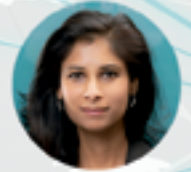
Gita Gopinath Economista Jefe del Fondo Monetario Internacional (FMI)