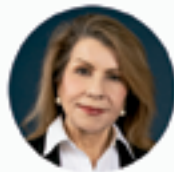
Carmen Reinhart Economista Jefe del Banco Mundial