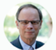
Jean Tirole Premio Nobel de Economía 2014