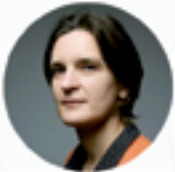
Esther Dufo Premio Nobel de Economía 2019