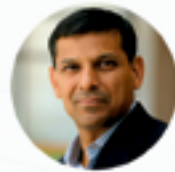
Raghuram Rajan Profesor de finanzas de la Universidad de Chicago