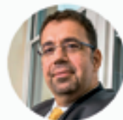
Daron Acemoglu Académico MIT