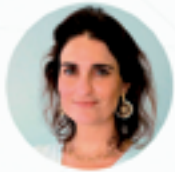
Ma. José Zaldívar Ministra del Trabajo