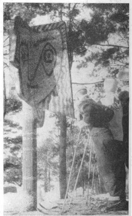
ESCULTURA EN HORMIGON NEGRO DE 3 M. DE ALTO REALIZADA POR CARL MESJAR SEGUN UNA MAQUETE DE PICASSO.

(DE AUJOURD'HUI ART ET ARCHITECTURE N.º 23)