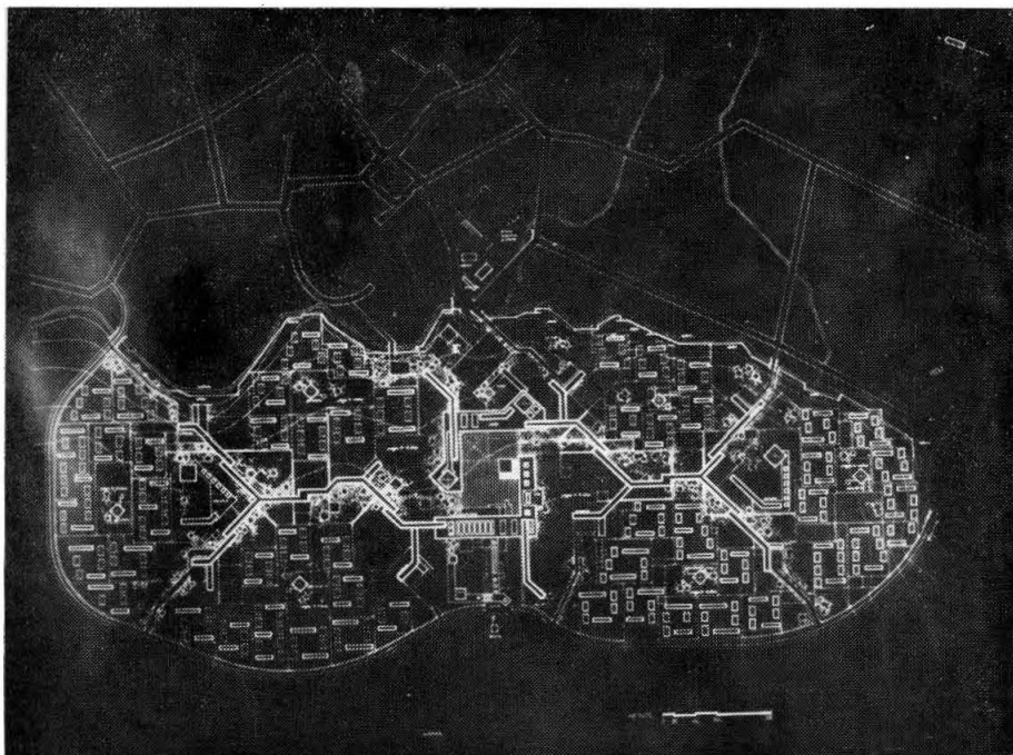
Plano general del proyecto.

Finalmente existe un Liceo en el Centro Cívico de la Unidad.